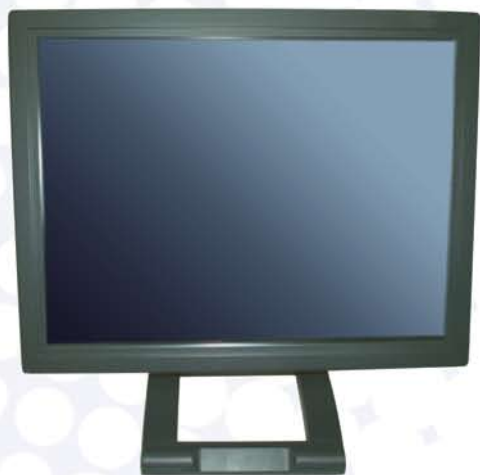
Monitor TFT LCD color de 15"