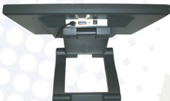
Conector PC D-SUB 15 Pins