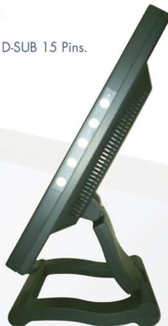
Controles perfectamente integrados al panel lateral