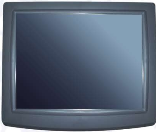
Pantalla TFT color de 15"