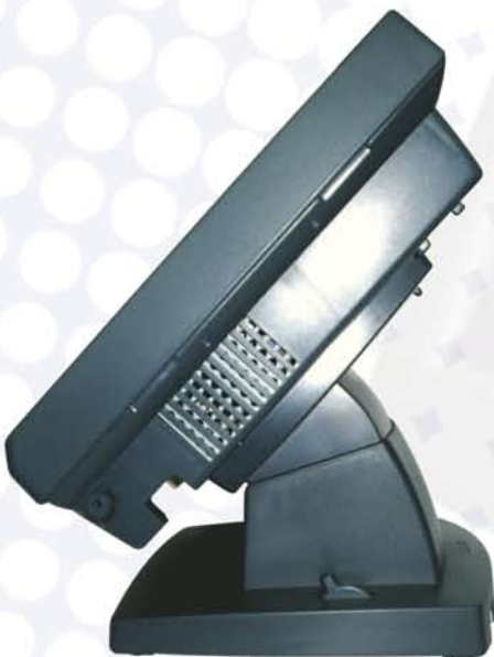
Ángulo de inclinación variable de 17.5° a 87.5°