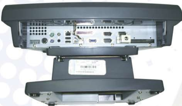
4 puertos serie, 1 puerto paralelo y 2 puertos USB