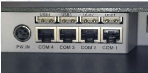
4 puertos serie, 1 paralelo y 4 puertos USB