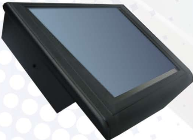
Elegante y compacto