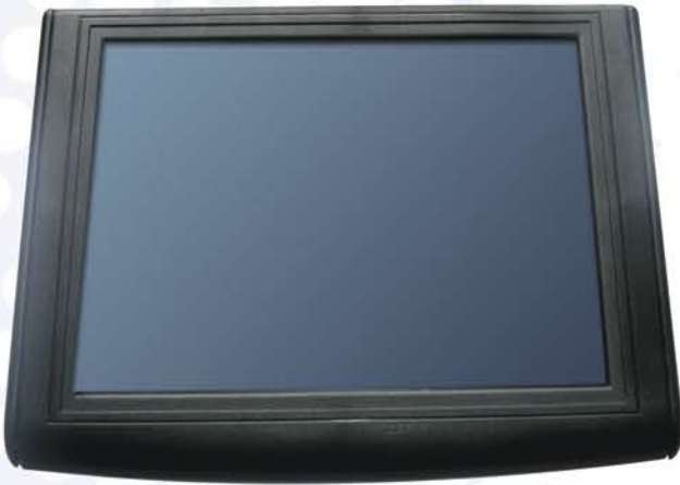
Pantalla TFT color de 10.4"